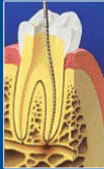
Sinir dokusu alınıp kökler temizlenip şekillendirilmiş diş