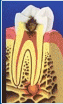
Kök ucu iltihaplı diş

Eğer hasarlı veya hasta pulpa uzaklaştırılmazsa dişin kökünü çevreleyen dokular enfekte olabilir. Ağrı ve şişliğe neden olan bir apse oluşabilir. Ağrı olmasa bile, bakterilerden salınan bazı artıklar dişi çeneye bağlayan kemiğe zarar verebilir.Bu da bazı sistemik hastalıklara neden olur. Tedavi edilmezse dişin çekilmesi gerekebilir.